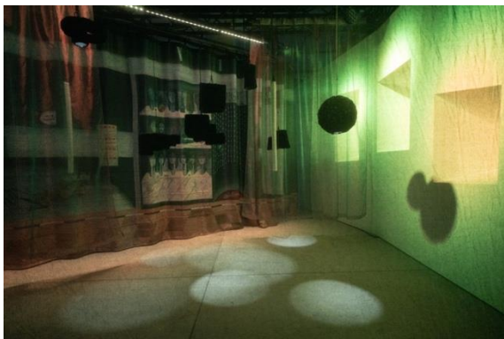
機動裝置（吳子昆創作）