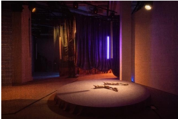
機動裝置（董永康創作）