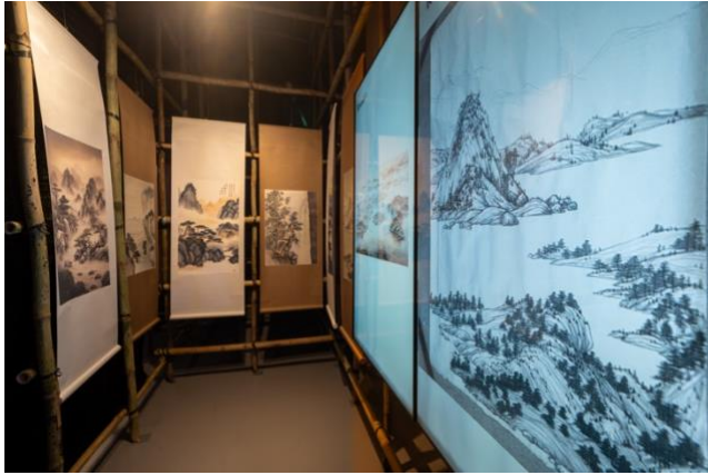
《血戰 AI - 徐沛之繪畫》徐沛之